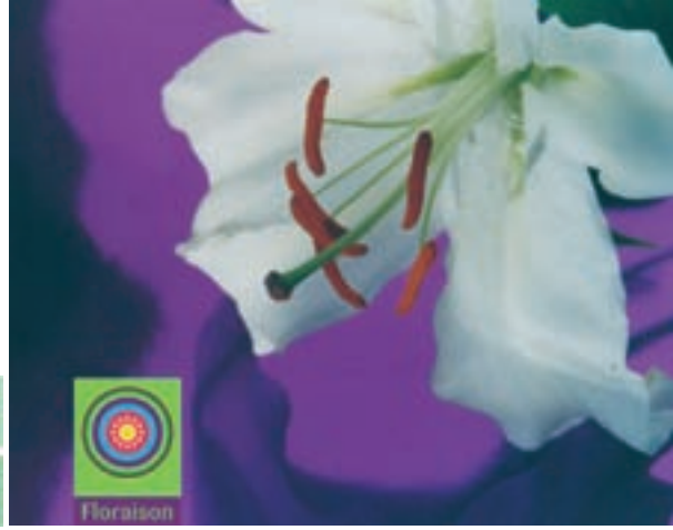
01 Mignon Heubeck // »Floraison« >Blumenübertopf >Einsteckschildchen >Rechnungsblätter